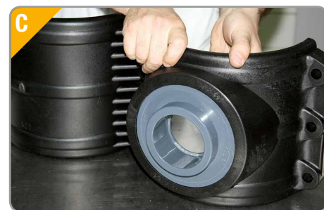
C. Introducir la boca en el agujero del collarín.