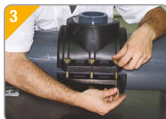
3. Repetir la operación sobre la tornillería cuantas veces sea necesario.