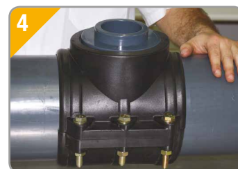
4. Si fuera necesario, ayudarse de las herramientas pertinentes para llevar a cabo la operación, ya que la tornillería debe estar ajustada hasta su tope , pues de este modo no se producirán movimientos en el collarín por golpes de ariete.