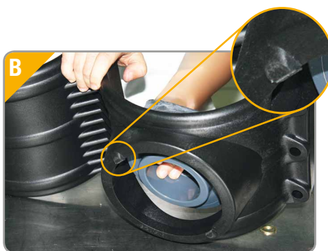
B. El Collarín dispone de un relieve , en su superficie interior, donde encajará perfectamente la hendidura de la boca.