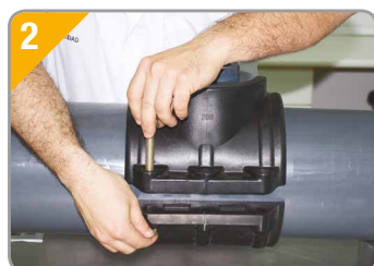
2. Colocar tornillería y comenzar el apriete de la misma paulatinamente y con presión similar.