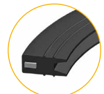
MODELO JUNTA “J-BIL” NETVITC SYSTEM® NETVITC SYSTEM O-RING MODEL “J-BIL” Con alma de Acero Inoxidable en su interior

Por su sistema de enlace Netvitic System® , para un correcto desmontaje es imprescindible que la instalación de la tubería permita una movilidad suficiente para extraer la junta y facilitar posteriores operaciones de montaje y desmontaje.