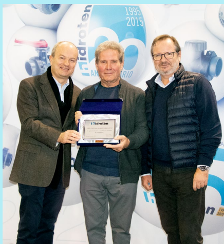
Gerencia no se olvida de los que dedicaron su labor a Hidroten a lo largo de estos 25 años.

El pasado 20 de diciembre, tuvo lugar en las instalaciones de Hidroten , la tradicional comida de Navidad, un encuentro cercano donde trabajadores, clientes, proveedores y amigos comparten en estas entrañables fechas.