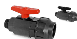
717/725 SALIDA FITTING - R/M Desde \varnothing 20-1/2" a 32-1"