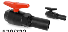
570/722 SALIDA R/H - PE Desde \varnothing 20-1/2" a 63-2"