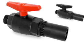
571/723 SALIDA R/M - PE Desde \varnothing 20-1/2" a 32-1"