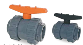
643/648 SALIDA ENCOLAR Desde \varnothing 20 a 90