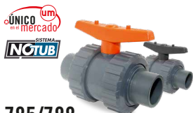
785/788 SALIDA ENCOLAR MACHO Desde \varnothing 20 a 63