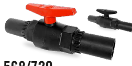
568/720 SALIDA PE Desde \varnothing 20 a 63