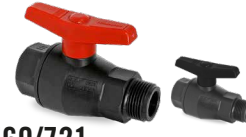
569/721 SALIDA R/H - MACHO Desde \varnothing 1/2" a 2"