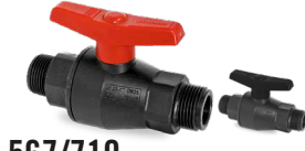
567/719 SALIDA ROSCA MACHO Desde \varnothing 1/2" a 1"