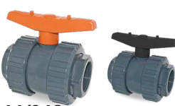
644/649 SALIDA MIXTA ENCOLAR R/H Desde \varnothing 20-1/2" a 90-3"