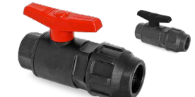
716/724 SALIDA FITTING - R/H Desde \varnothing 20-1/2" a 32-1"