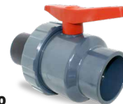
728 SALIDA ENCOLAR - PE Desde \varnothing 50 a 110