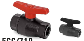
566/718 SALIDA ROSCA HEMBRA Desde \varnothing 1/2" a 3"

Válvulas disponibles en cierre PTFE y VITON