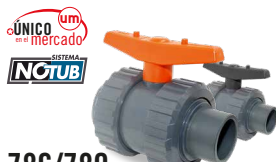
786/789 SALIDA ENC. M. - ENC. H. Desde \varnothing 20 a 63