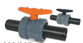
686/687 SALIDA TERMOFUSIÓN Desde \varnothing 20 a 90

Válvulas disponibles en cierre PTFE y VITON