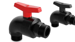
885/887 ACODADA R/M - R/M Desde \varnothing 1/2"-1/2" a 3/4"-1"