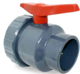
726 SALIDA ENCOLAR-ENCOLAR Desde \varnothing 50 a 110