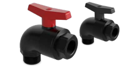
886/888 ACODADA R/M - R/H Desde \varnothing 1/2"-1/2" a 3/4"-1"