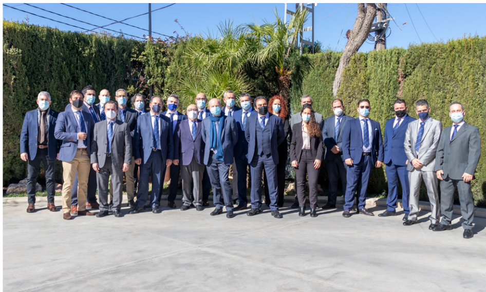
Convención General de Agentes 2022

Tras dos años de restricciones y medidas adoptadas, el 17 de febrero se celebró en nuestras instalaciones la cita comercial más importante del año, la Convención General de Agentes 2022 de forma presencial .